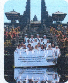
PMM 3 - Univ. Udayana sub Modul Kebinekaan Pura Besakih