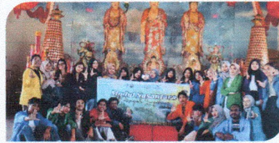
PMM 3 - Univ. Bosowa Sub Modul Kebinekaan Kelenteng tertua di Makassar