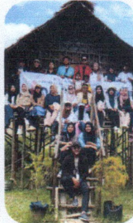
PMM 3 - Unimuda Soror Modul Kebinekaan