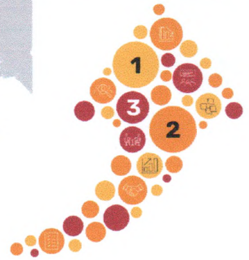
Data peta sebaran Mahasiswa peserta PMM 3 tahun 2023