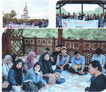
PMM 3 - Universitas Samudra Aceh sub Modul Refleksi - Sejarah, Adat, dan Tradisi